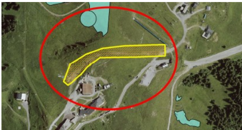
Position des dépôts "Oratoire" par rapport aux zones humides.

Le dérangement de la faune, en raison des rotations de camions transportant les matériaux, sera, sans doute, plus important dans la solution retenue que dans celle qui était initialement prévue.